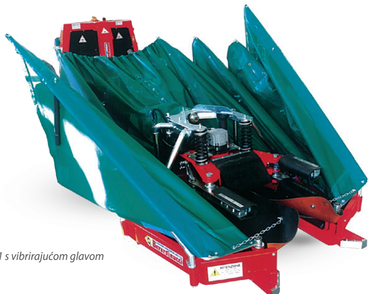
Prihvatni uređaj RMA 1 s vibrirajućom glavom